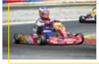
C. Van Dam

Pneumatico destinato alle competizioni internazionali delle categorie FA, FSA e SUPER ICC. Dotato di mescola di battistrada ad elevato grip su una struttura ad altissimo livello tecnologico. È la massima espressione dell'effetto "guida su un binario" con doti di scorrevolezza incredibili.