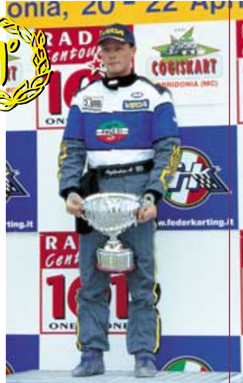
🇮🇹 M. Rytтарbris

European Vice Champion 125 Formula C Vice Campione Europeo